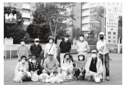
清掃活動時の一枚

ら漏れた」の言葉で「あれ！中国でも細菌兵器の研究をしている！」と思われた方は多かったのではないのでしょうか。というのは六十数年前、上司から聞き印象に残っている話を思い出したからでした。