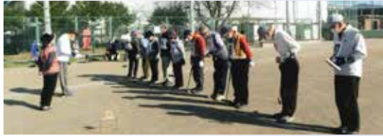
選手勢ぞろいです