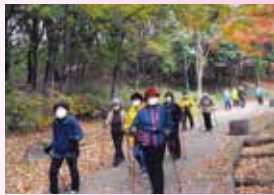
紅葉が美しく映えます

11月27日(金)にまちづくり館集合・解散で実施され、36名が参加されました。天気も良く紅葉が見頃を迎えた中央公園一周を楽しみました。