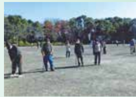
中間の活躍を見守ります