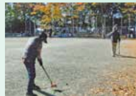
勢いよくスイング