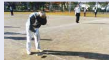
目指すはゲート通過