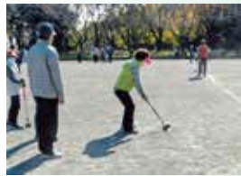
目指すはナイスショット

11月11日(水)東方公園で開催され、23クラブ39チーム233名が参加しました。