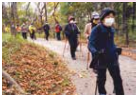
力強く歩を進めます