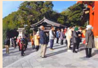
明るい新年を願って

は都田・荏田地区、30日(月)は中川地区からそれぞれ5台のバスが出発し、鎌倉・円覚寺と八幡宮、城ヶ島の秋の風情を楽しみました。約400名。バスは消毒・換気に特に力を入れました。また、昼食会場もお互いの席を十分に離して開催されました。