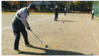
球の行方やいかに